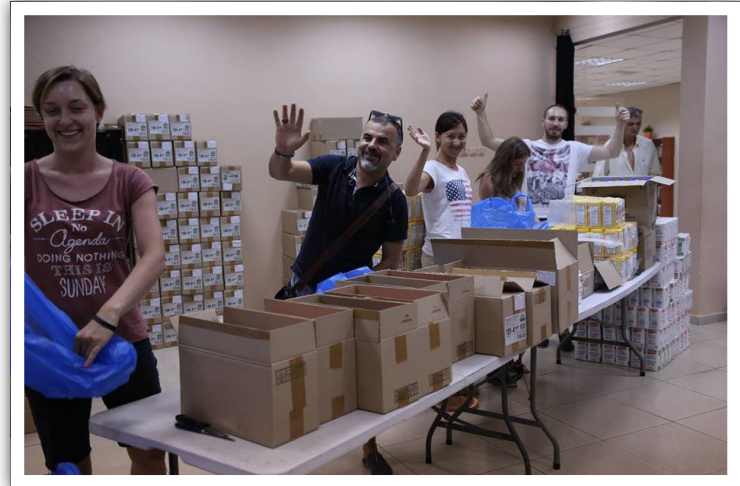
Ruokalaatikat syntyvät talkootyönä.