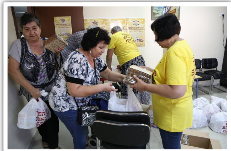
Ruoanjakokeskukseen pakkautuu satoja apuutarvitsevia ruoanjakopäivinä.