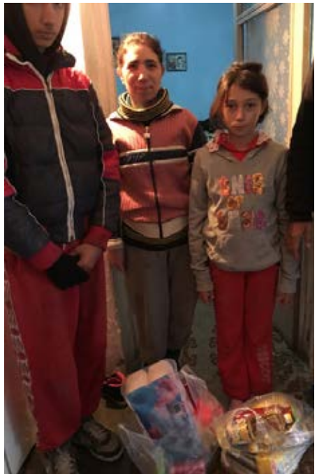
Tämän perheen ahdinko alkoi kun perheen isä sokeutui. Sinun lahjasi on auttanut selviytymään. Kiitos!