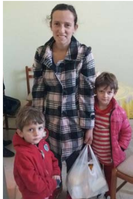
Kylmään, kosteaan kotiin lämmitin ja kaksi kassillista ruokatarvikkeita. Ei ihme, että äitiä hymyilyttää