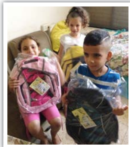
Yli 300 koululaista lähti kouluun uusi reppu selässä

Israeliin juuri saapuneille seurakunta järjestää juutalaisten juhlien yhteydessä tutustumisiltoja, joihin kerääntyy satoja ihmisiä. Illan päätteeksi osallistujat saavat