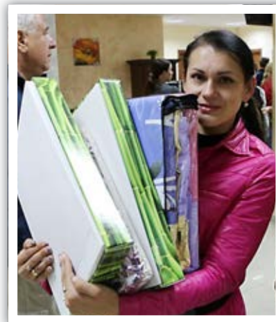
Perhepaketista löytyy myös liinavaatteita.