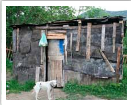
Äärimmäinen köyhyys näkyy katukuvassa