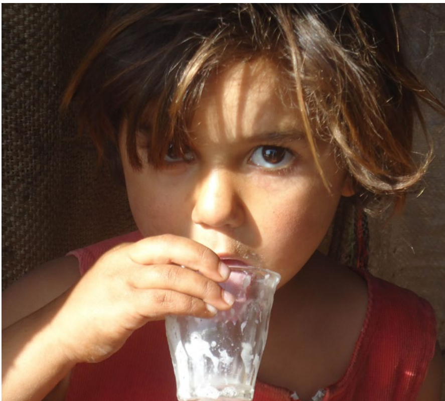
Du kan ge mig en framtid och ett hopp.

Vi har alla hört om ISIS-organisationens grymhet. Våldet tvingar miljontals människor att lämna sitt hemland. När du hör dessa sorgliga nyheter känner du dig hjälplös, kanske också arg. Du vill göra något, men vet inte riktigt vad. Genom Mätta de Hungrande-organisationen kan du säkert och effektivt hjälpa de förföljda. En ny hjälpförsändelse till flyktingarna i Libanon är just på väg. Ännu hinner du bidra med din gåva.