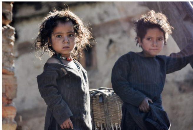
Dehär barnen har inte behövt vänta för länge på hjälp.