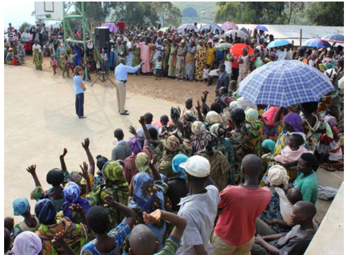
Pakolaisleirin 11 000 tuhatta lasta odottavat apuasi. Kuvassa edellisen ruokakuorman tuomaa riemua.