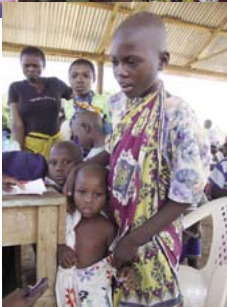
Nämäkin orpolapset saivat apua.

Muutama viikko sitten järjestimme ilmaisen lääkäripalvelun ja lääkityksen sadoille sairaille ihmisille Bahakwenukylässä, joka sijaitsee noin 110km Mombasasta. Saarnasimme evankeliumia näil-