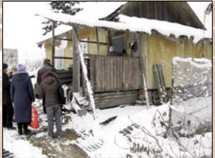
Ruokkikaa Nälkäiset tiimi käytännön työssä jakamassa ruokapaketteja.

Kun paikalliset avustajat näkivät mitä teimme ja kuinka kerroimme ihmisille Jumalan rakkautesta, he pitivät meitä aitoina kristittyinä ja haluavat ehdottomasti yhteistyön ja ystävyysjatkuvan. Tulimme jälleen vakuuttuneiksi siitä, että sosiaalinen työ avaa ihmisten sydämet ja kylien ovet evankeliumin työlle.