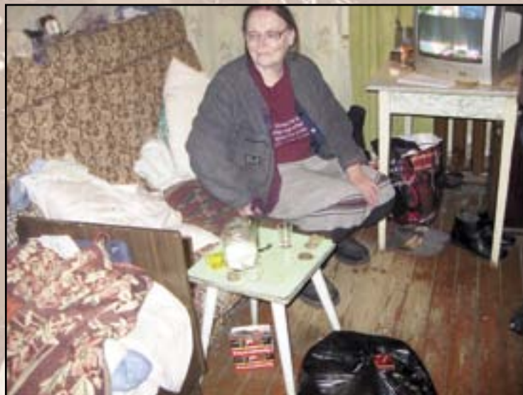
Tämä rouva saa säännöllisesti RN-ruoka-apua ja rohkaisua.

Meillä oli runsaasti hengellistä kirjallisuutta mukana. Kiitos teille, jotka teitte mahdolliseksi kirjojen oston. Kirjoja annettiin kaikille.