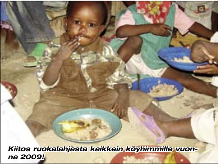
Kiitos ruokalajasta kaikkein köyhimmille vuonna 2009!

Ruokkikaa Nälkäiset ry kiittää sinua tuestasi ja rukouksistasi vuoden 2009 aikana ja toivottaa Sinulle Siunattua Joulun aikaa ja Hyvää Uutta Vuotta!