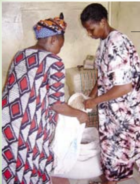
I Mikindanis slumområde utdelas mathjälp till behövande mammor.

De flesta av invånarna i Kibaranis slum söker sin mat på avstjälningsplatsen. De är de fattigaste av fattiga. MdH-mat utdelas i slumskolan till 120 små elever. De mår mycket bättre då de får hälsosam och ren mat regelbundet. Mathjälp har också gjort deras föräldrar öppna för evangelium.