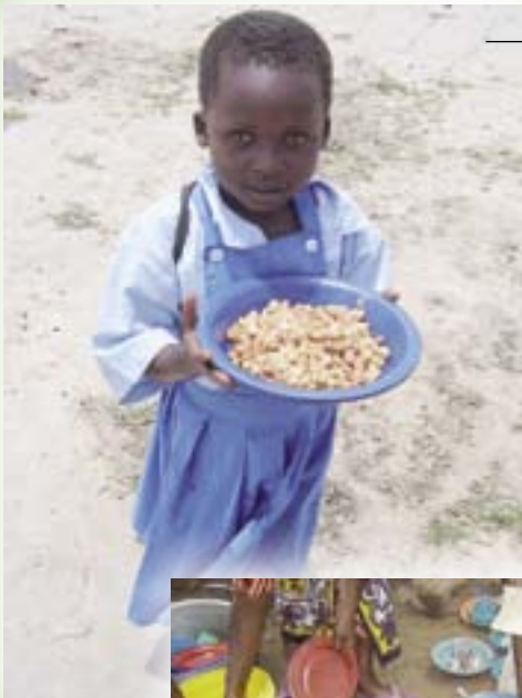
Jimba är en fattig avlägsen trakt med torka, där det råder brist på mat. 150 barn i Jimba får MdH-lunch på "daghemmet" varje dag.